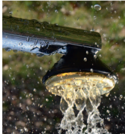
KRISTALL-WIRBEL-DUSCHE MIT DNA-STRUKTUR. (WENN DAS WASSER NUR GANZ LEICHT AUFGEDREHT IST)

Leider haben die wenigsten Menschen direkten Zugang zu verwirbeltem und naturbelassenen Wasser. Nicht Jeder wohnt direkt an einer naturbelassenen Quelle oder an einem frei fließenden Gebirgsbach.