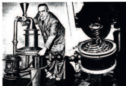
Viktor Schaubberger: Heimkraftwerk

tarium zur naturrichtigen Weiterleitung des Wassers.