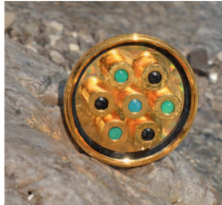
INNENANSICHT EINER WIRBEL-DUSCHE MIT 7 KRISTALL-KAMMERN

unmittelbar mit dem Grundmuster der Natur und Universums in Resonanz.